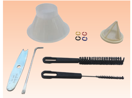
Le kit SRi Pro Lite contient le pistolet avec son réglage commandé, un godet gravité, un entonnoir, une clef, une clef Torx et des brosses de nettoyage.

Pour plus d'informations techniques, veuillez-vous référer au service bulletin du SRi Pro Lite.